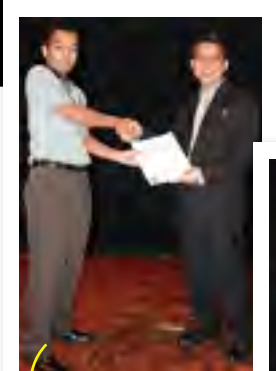
CONAN @ SRR Kategori: Kumpulan Harapan