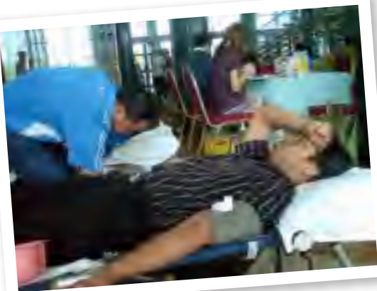
TURUT SERTA... Staf Pustaka turut serta di dalam Program Menderma Darah oleh Pusat Perubatan Pakar Normah

Untuk aktiviti sepanjang minggu Inovasi, Bahagian Perhubungan Awam dan Pemasaran telah membuka Kaunter Hari Bersama Pelanggan di Lobi Pustaka Negeri Sarawak. Antara aktiviti-aktiviti yang diadakan ialah Penjualan CD dan Buku Siri Sarawakiana, "Information Repackaging" dan pameran tentang perkhidmatan yang ada di Pustaka Negeri Sarawak. Selain daripada itu, pengunjung-pengunjung juga menerima pelbagai cenderamata menarik dan eksklusif dari Pustaka Negeri Sarawak apabila menjawab kuiz-kuiz yang diberikan. Pusat Pakar Perubatan Normah telah turut serta di dalam Program Derma Darah yang diadakan pada hari terakhir minggu Inovasi.