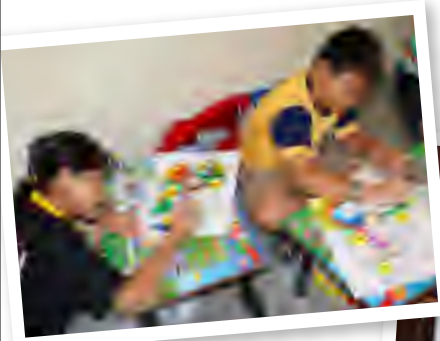
CONCENTRATION... Two of the contestants showing their coloring.

by Sofina Tan (sofina@sarawaknet.gov.my)