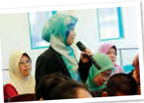
Semasa sidang RANDAU

Merupakan cadangan staf yang telah diimplementasikan dengan jayanya. Ianya bercorak satu forum di mana para staf, secara beramai-ramai dapat bersemuka dengan pihak pengurusan pada satu masa yang dirancang. Di sini, para staf dapat mengutarakan secara lisan atau bertulis pandangan, cadangan dan ada kalanya keluhan perasaan tentang hal-hal berkaitan kerja, kemajuan kerjaya dan persekitaran tempat kerja. Sepanjang tahun 2010, sebanyak 3 majlis RANDAU dapat disempurnakan tetapi hanya sekali dapat diadakan di Pustaka Miri kerana faktor kos.