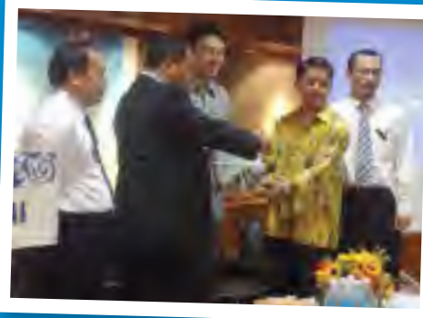
PENYERAHAN... 5 naskah buku 'Yesterday's Frontier, Tomorrow's Powerhouse' diserahkan oleh Pejabat Resident Bahagian Kapit kepada Pustaka Negeri Sarawak

Seramai 61 orang peserta telah menyertai seminar tersebut. Peserta adalah terdiri daripada agensi kerajaan, agensi swasta, ketua masyarakat, persatuan-persatuan, sekolah dan orang awam. Selain wakil daripada Pustaka Negeri Sarawak, pembentangan kertas kerja seminar turut melibatkan penceramah daripada jabatan lain seperti Perbadanan Harta Intelek dan Perpustakaan Negara Malaysia.