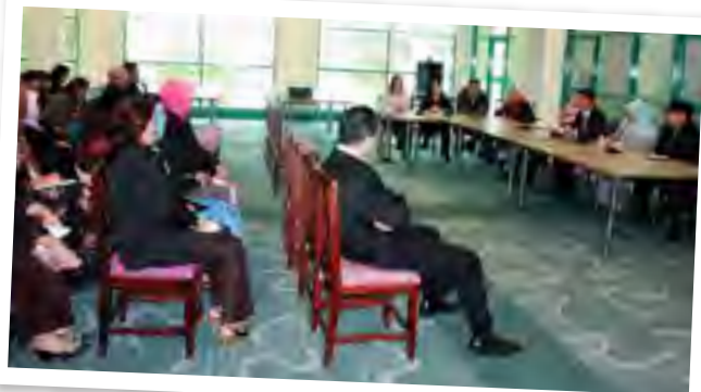
Semasa sidang RANDAU