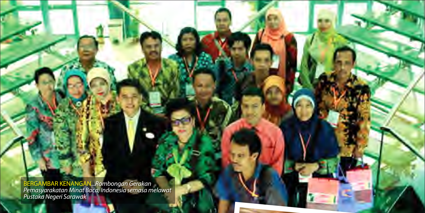
BERGAMBAR KENANGAN... Rombongan Gerakan Pemasarakatan Minat Baca, Indonesia semasa melawat Pustaka Negeri Sarawak