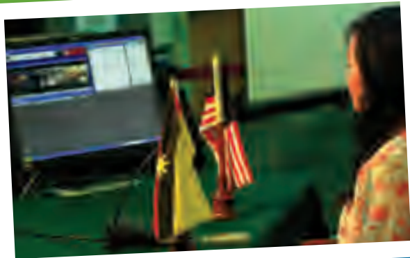
TOWNINTERVIEW... A webchat with US State Secretary Hillary Rodham Clinton.