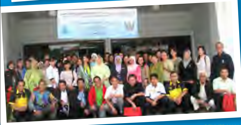
KENANGAN... Bergambar bersama sebahagian daripada peserta seminar.

oleh Jassalini Jamain (jassalii@sarawaknet.gov.my)