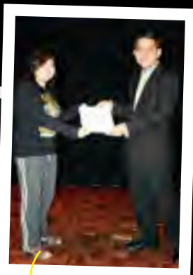
BEN10 @ SRR Kategori: Kumpulan Harapan