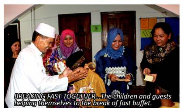
BREAKING FAST TOGETHER... The children and guests helping themselves to the break of fast buffet.