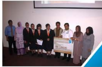
TERBAIK... Pemenang tempat pertama Pertandingan Perpustakaan Keluarga Helena (hadapan) menerima piala dan sijil kemenangan beliau.

MIRI... Pertandingan Warisan Budaya Tempatan 2013 yang diadakan bermula bulan Februari lalu adalah terbuka kepada semua sekolah-sekolah menengah di sekitar Bandaraya Miri.