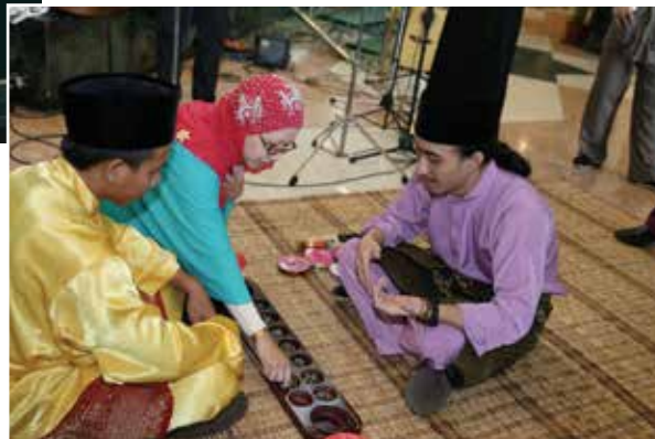
■ Congkak competition