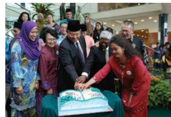
■ The cake cutting ceremony for August Staff's Birthday celebrations

By Alya Faeqah Hamali (alyafh@sarawak.gov.my)