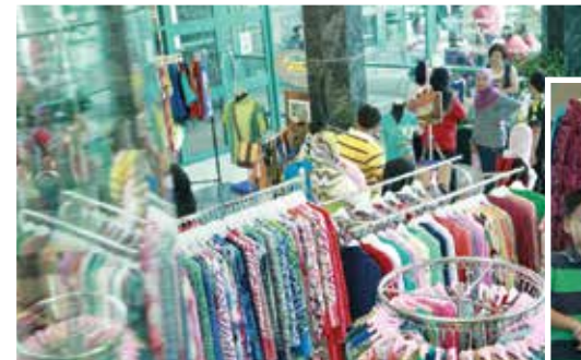
■ Flea Bazaar