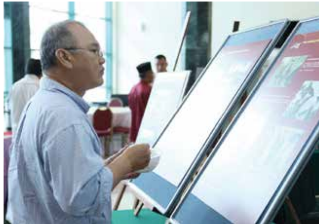
■ Memory of Independence exhibition

The event was organized for their stakeholders and partners, while recruiting members and 'Friends of Pustaka'.