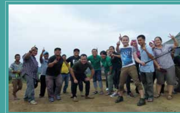
ROMBONGAN PUSTAKA.. Staf Pustaka Negeri Sarawak semasa dalam perjalanan ke Long Laput.

Oleh: Muhammad Shahrul Bahro (sharulbee@sarawak.gov.my)