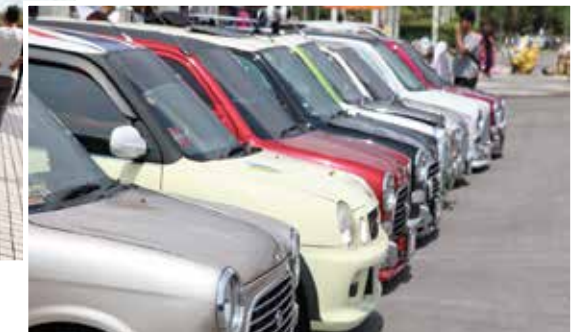
■ Pameran Kereta