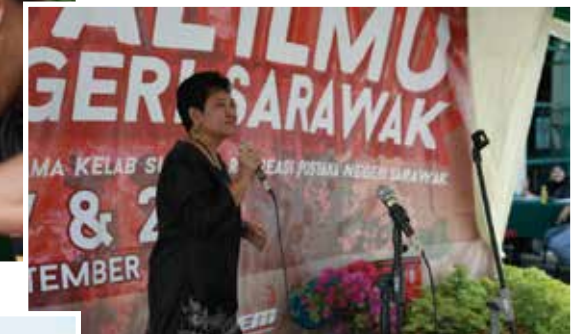
■ Pertandingan Karaoke 'Pustaka Talent Search'