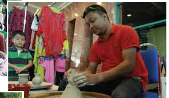
■ Pameran Agensi Kerajaan