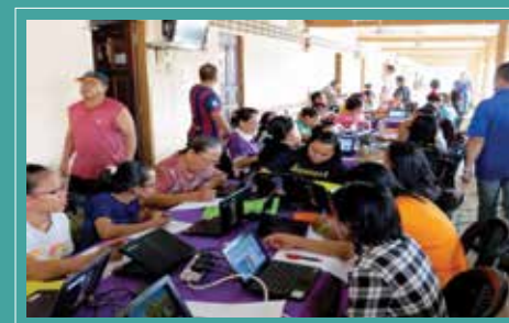
FOKUS.. Para peserta program tekun menyelesaikan soalan ujian semasa program penilaian semula dilakukan di Long Laput.

Pada 3-5 September yang lalu, Pustaka Negeri Sarawak telah dengan jayanya mengadakan program Kembara Ilmu 2014. Program ini adalah program kerjasama Pustaka Negeri Sarawak dengan Natural Resource Environment Board (NREB), Malaysian Nature Society (MNS), Red Crescent Miri, Suruhanjaya Komunikasi dan Multimedia Malaysia (SKMM) dan Danawa Resources Sdn Bhd.