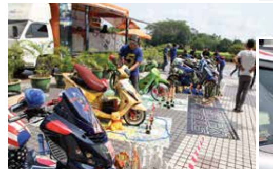
■ Pameran Motosikal