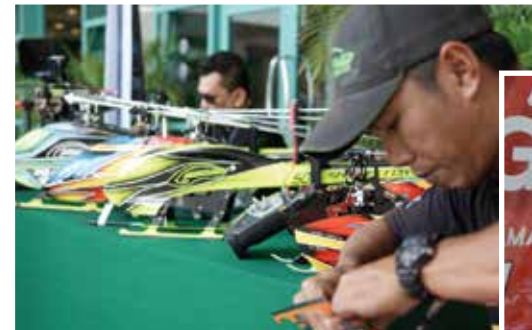
■ Demonstrasi Alat Kawalan Jauh Helikopter