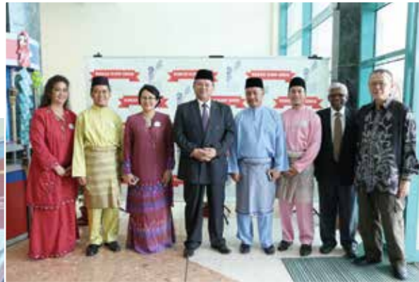
■ The Management of the Board with the Chief Executive Officer and Senior Officers of Pustaka

The event was organized for their stakeholders and partners, while recruiting members and 'Friends of Pustaka'.