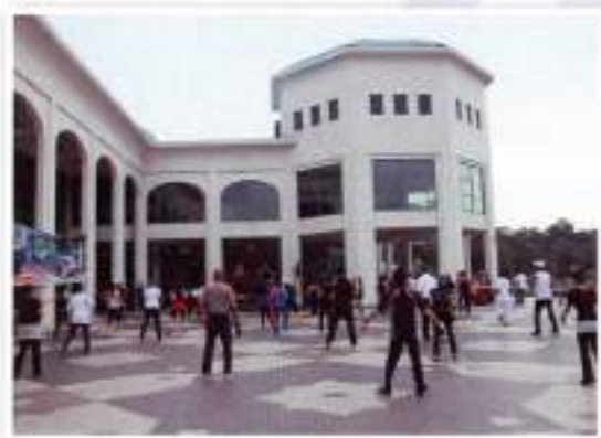
Exercise / Senaman