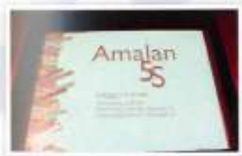
SS Practice / Amalan SS