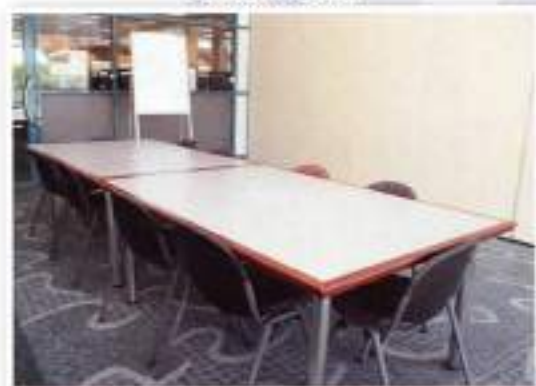
Discussion Room / Bilik Perbincangan