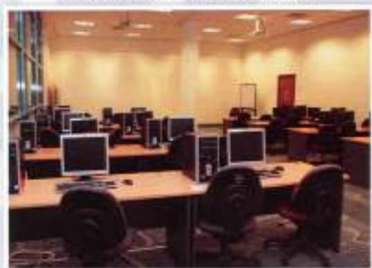
ICT Training Room / Bilik Latihan ICT