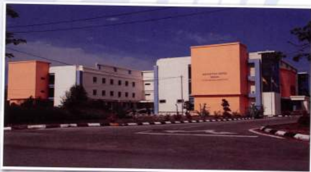
State Record Repository