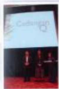
Q-Suggestions and Q-Slogan / Cadangan Inovatif Q dan Slogan Q