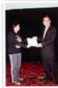
BEN10 @ SRR Category: 'Kumpulan Harapan' / Kategori: Kumpulan Harapan