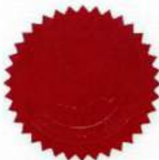
(TOIEYAH BINTI HJ. TIOH) b.p. KETUA AUDIT NEGARA MALAYSIA

Pada pendapat saya, Penyata Kewangan ini memberi gambaran yang benar dan saksama terhadap kedudukan kewangan Pustaka Negeri Sarawak pada 31 Disember 2010 serta hasil operasi dan aliran tunai untuk tahun tersebut adalah selaras dengan piawai perakaunan yang diluluskan.