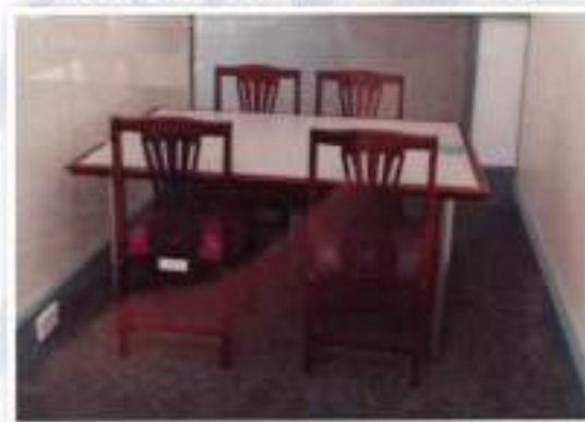
Researcher Room / Bilik Penyelidik