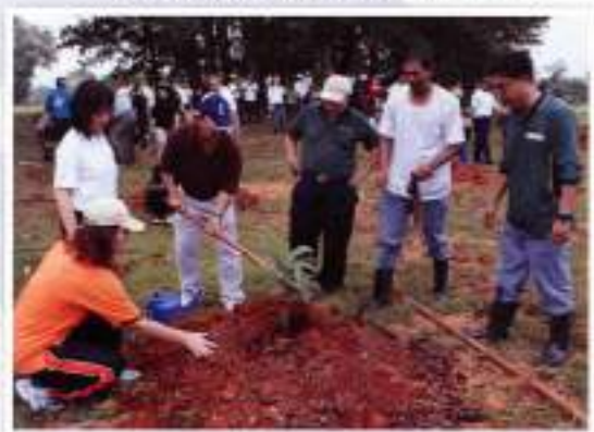
Tree Planting / Penanaman Pokok