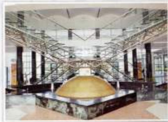
The glass staircase and the fountain from various angles Tangga kaca dan air pancut dari pelbagai sudut