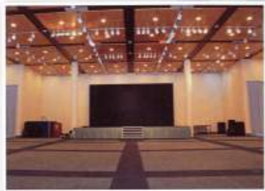
Gallery / Galeri