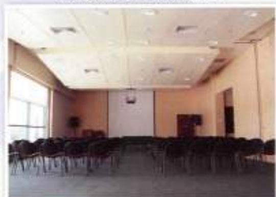
Seminar Room / Bilik Seminar