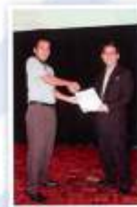
Tantaru Sinbel @ SRR Category: Best Group / Kategori: Kumpulan Terbaik