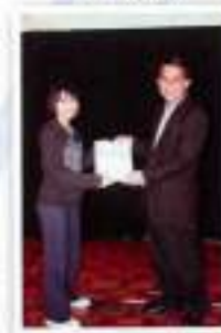
CONAN @ SRR Category: 'Kumpulan Harapan' / Kategori: Kumpulan Harapan