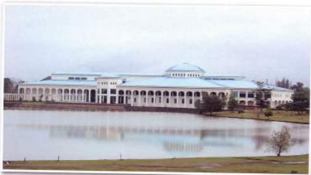
Pustaka Negeri Sarawak