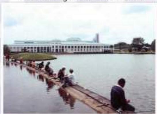
Angling / Memancing