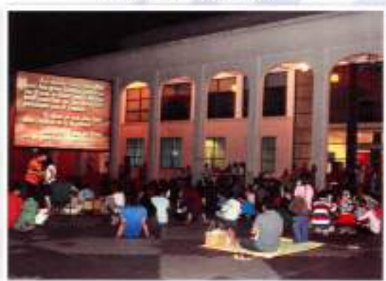
Movie Screening / Tayangan Filem