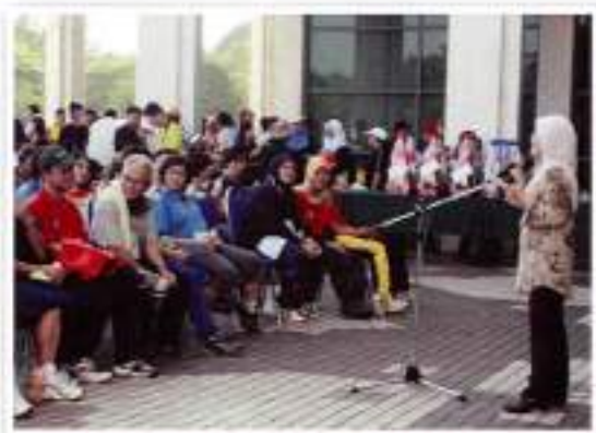
Public Talk / Ceramah Umum