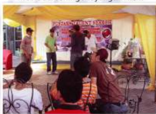
Talent Search / Uji Bakat