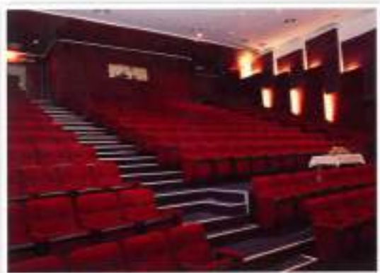
Auditorium / Auditorium